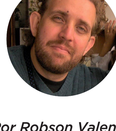
Por Robson Valentin

Esse é um espaço de crescimento e comunhão.