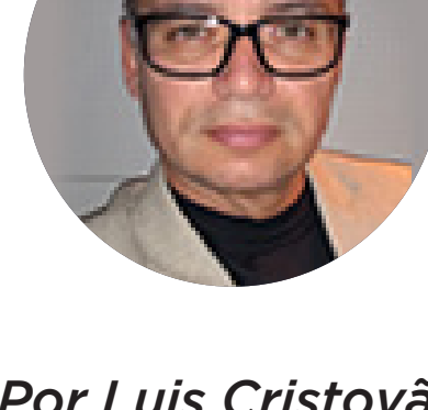
Por Luis Cristovão

Esse é um espaço de crescimento e comunhão.