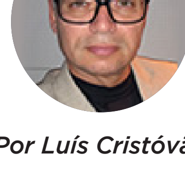
Por Luís Cristóvão

Esse é um espaço de crescimento e comunhão.