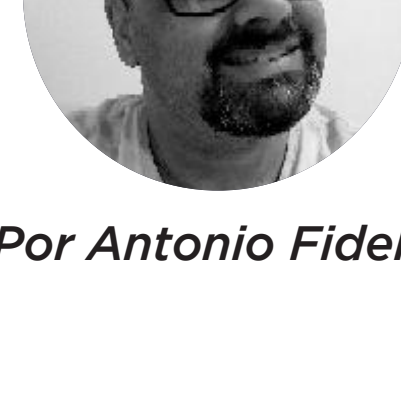
Por Antonio Fidelis

Esse é um espaço de crescimento e comunhão.